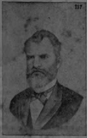
LICENCIADO DON JOSE JOAQUIN RODRIGUEZ

Candidato del Partido Constitucional triunfante en las elecciones de 1889.