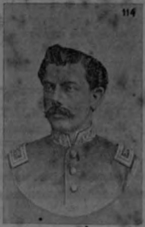
LICENCIADO DON BERNARDO SOTO

Presidente de la República quien depositó el mando en la noche del 7 de noviembre en el Tercer Designado Doctor don Carlos Durán.