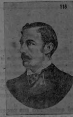
DON RAFAEL IGLESIAS

Candidato del Partido Constitucional triunfante en las elecciones de 1889.