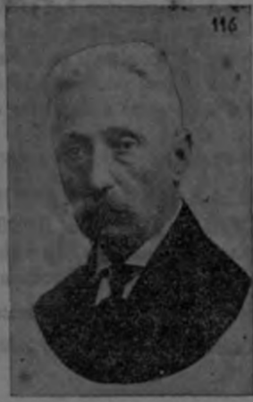
DR. DON CARLOS DURAN

Presidente de la República quien depositó el mando en la noche del 7 de noviembre en el Tercer Designado Doctor don Carlos Durán.